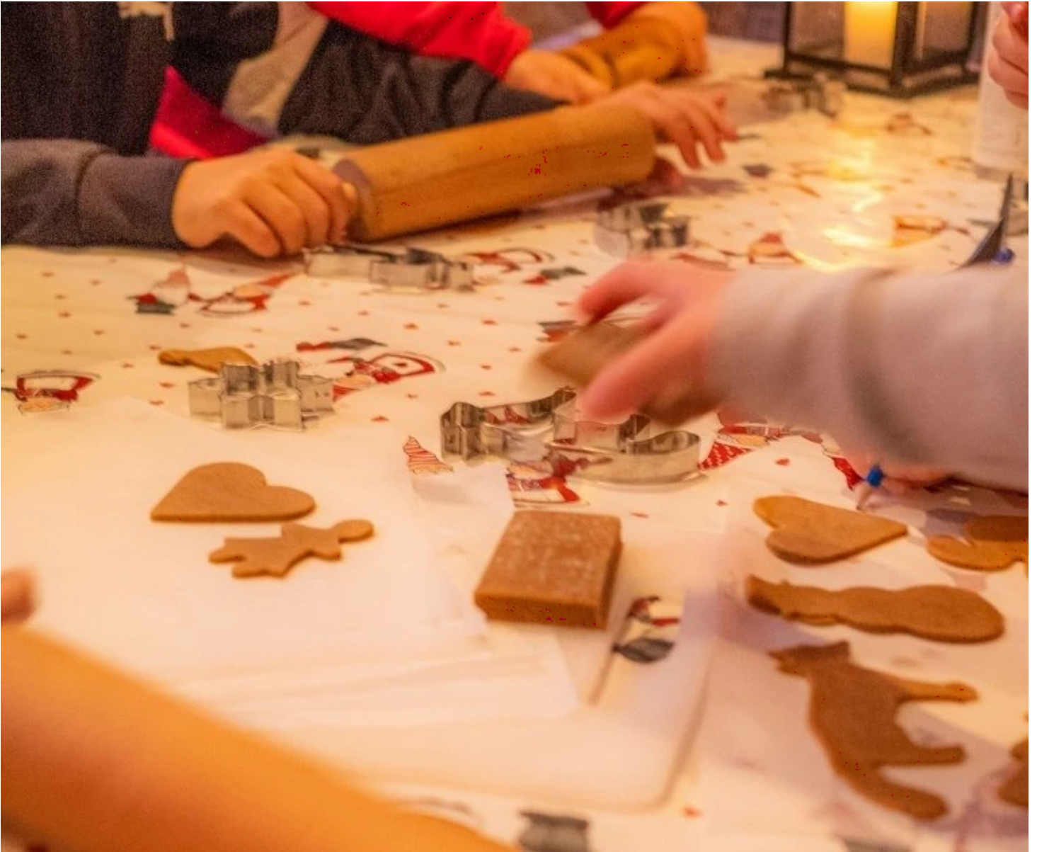
Atelier des petits chefs

Notre correspondant sur place se réserve le droit, pour des raisons techniques, de modifier l'ordre du programme, tout en respectant son intégralité. En fonction des conditions climatiques et/ou sanitaires, et pour votre bien-être, certaines activités peuvent également être aménagées différemment.