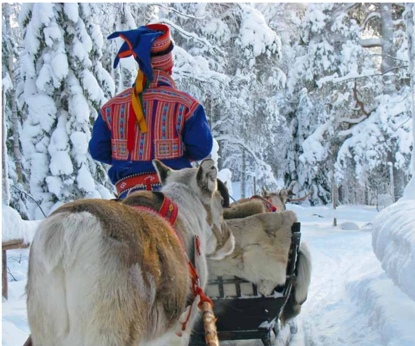
Eleveur de rennes