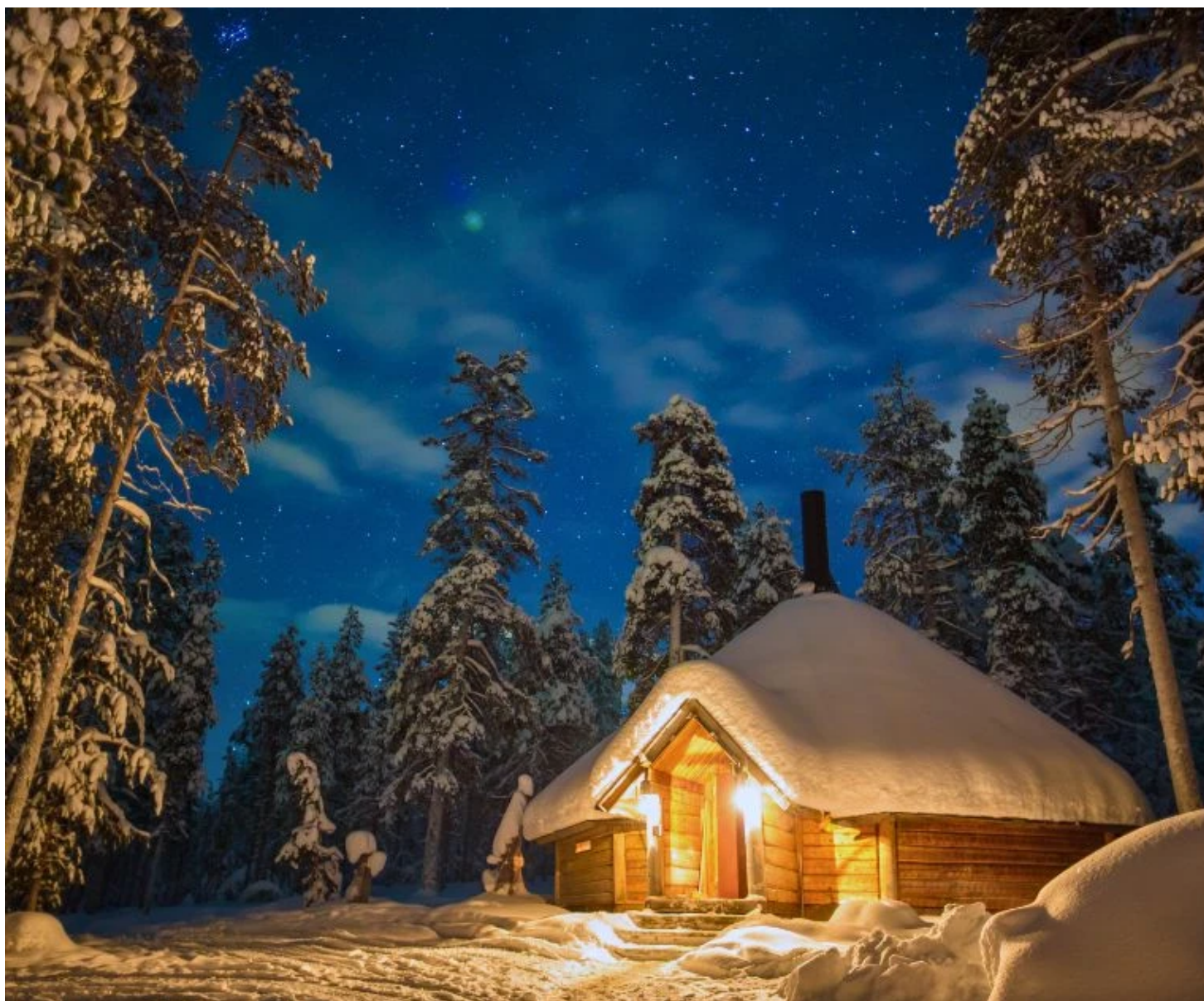
Kota de Vuontis