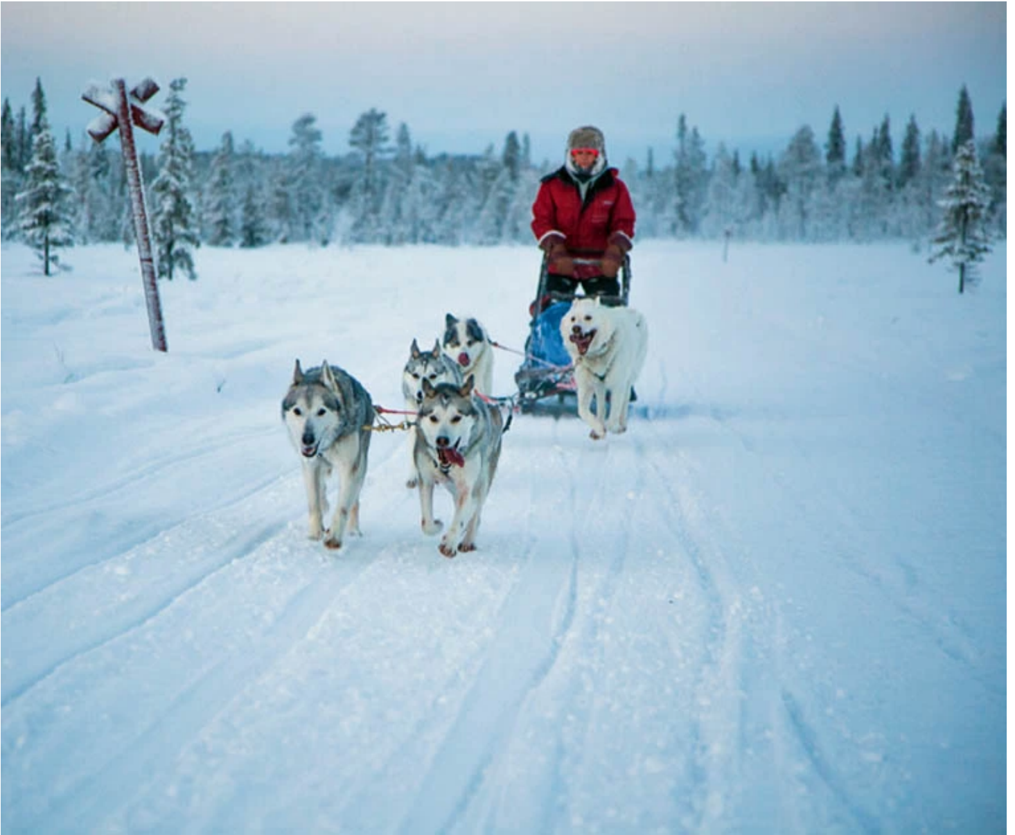
Traineau de chiens