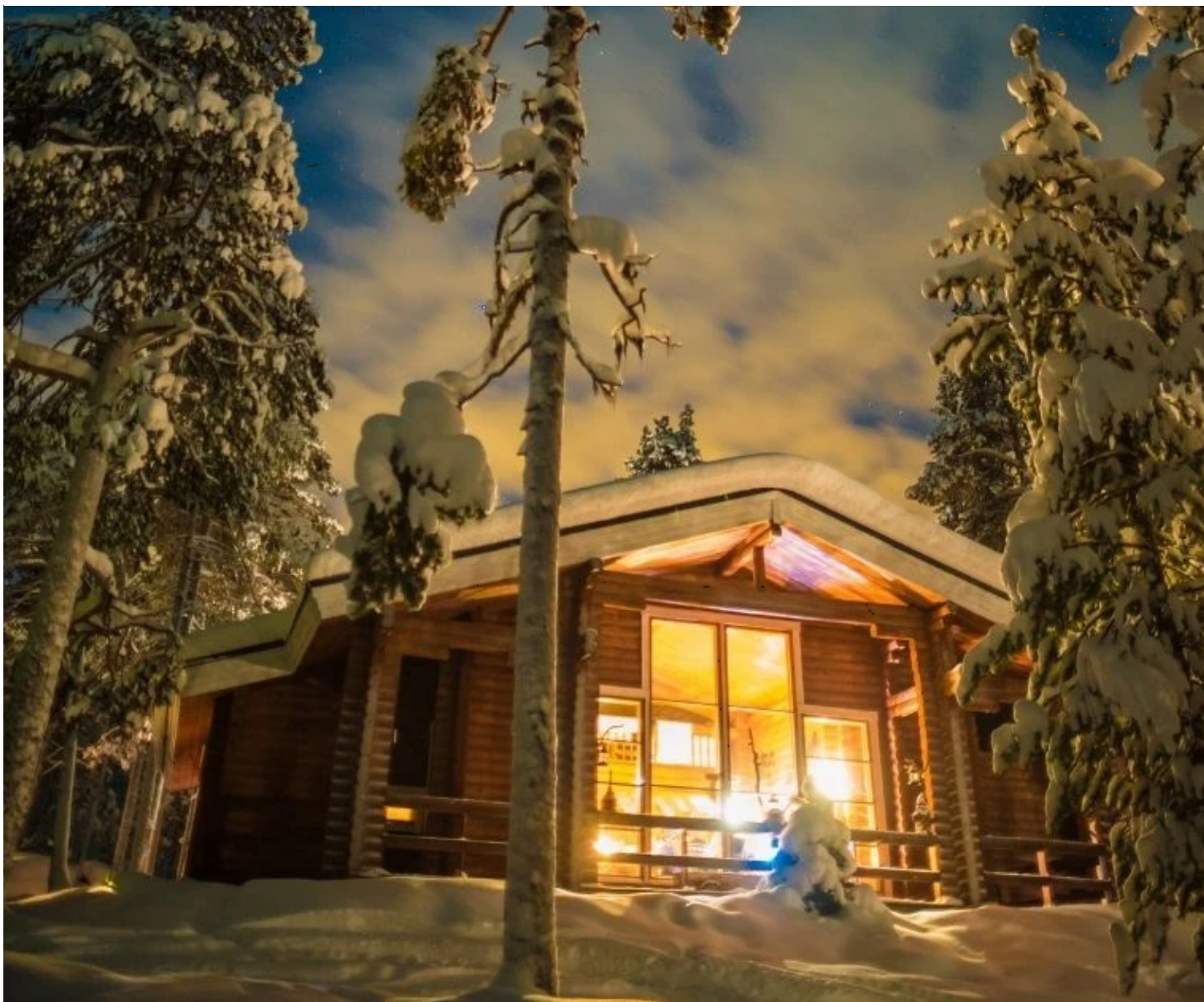
Chalet de Vuontis

Notre correspondant sur place se réserve le droit, pour des raisons techniques, de modifier l'ordre du programme, tout en respectant son intégralité. En fonction des conditions climatiques et/ou sanitaires, et pour votre bien-être, certaines activités peuvent également être aménagées différemment.