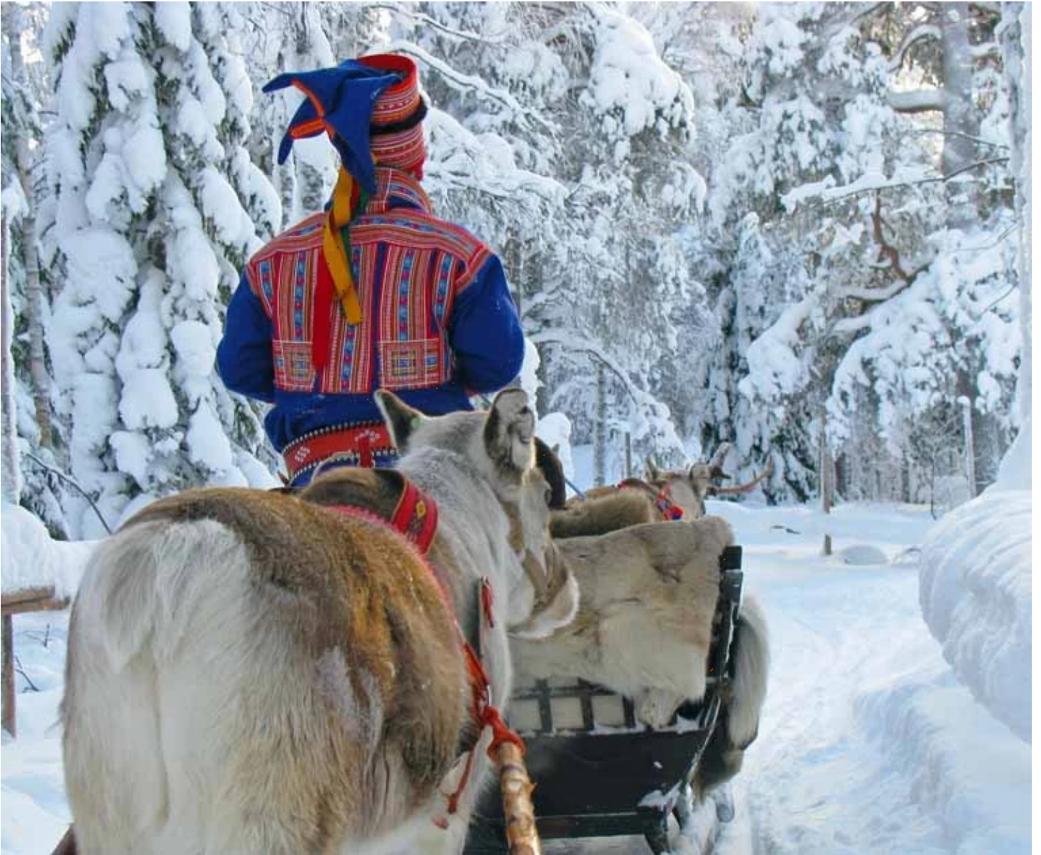
Eleveur de rennes