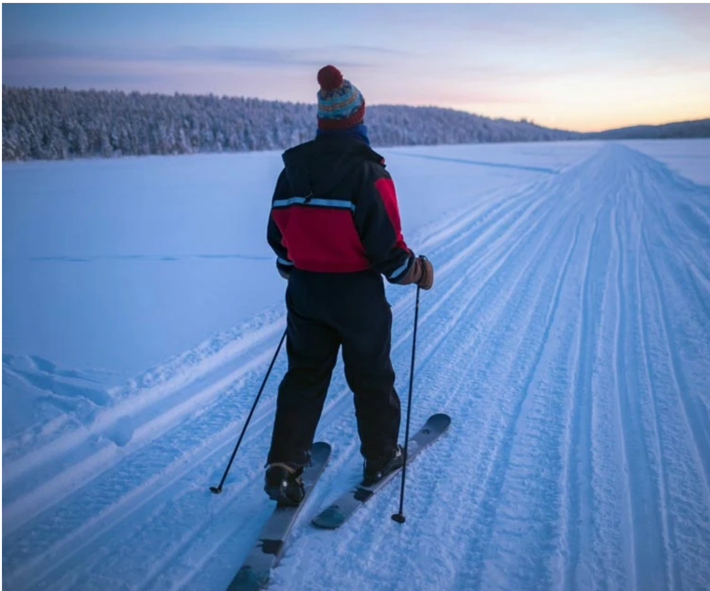
Ski de fond