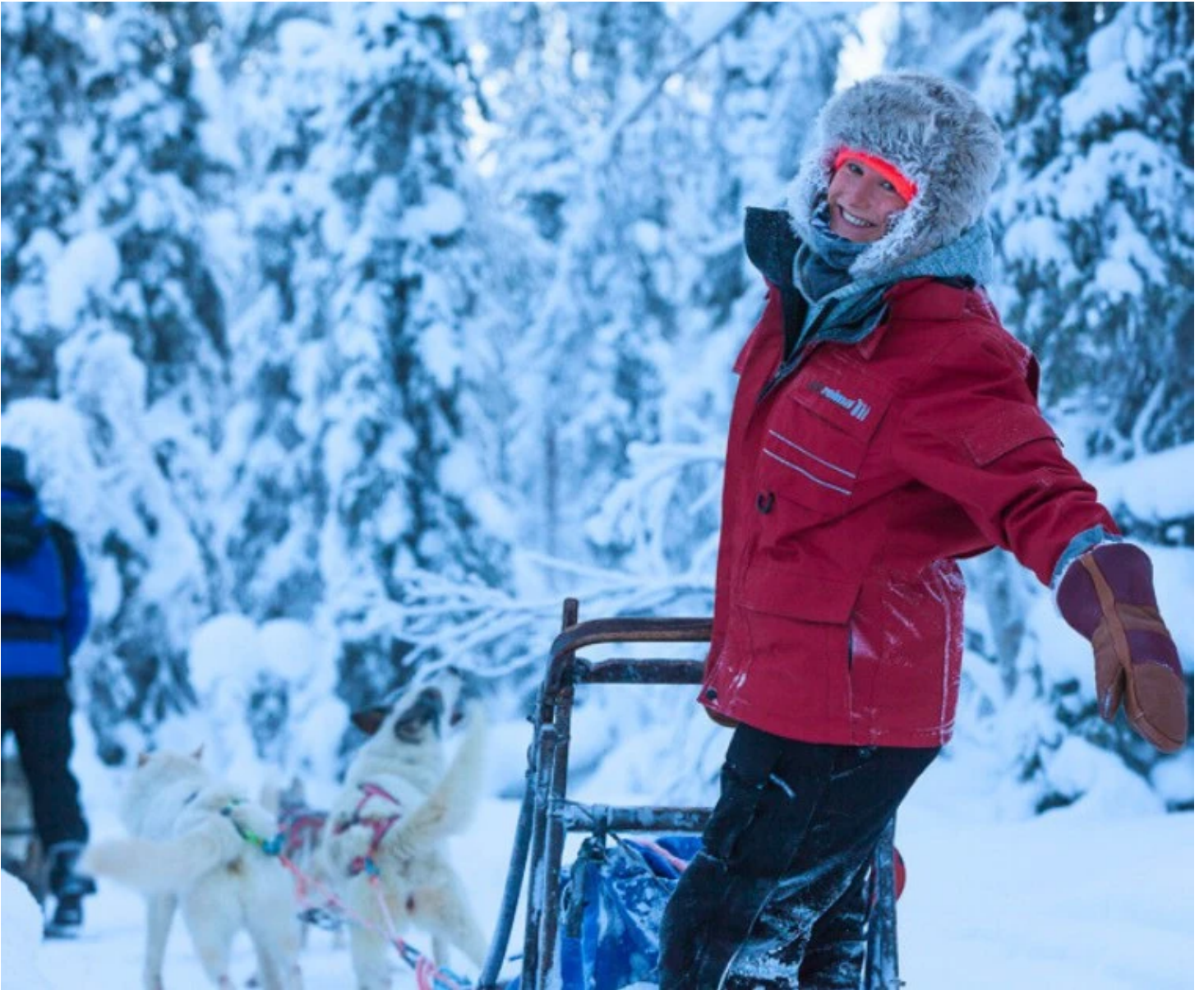
Traineau de huskies