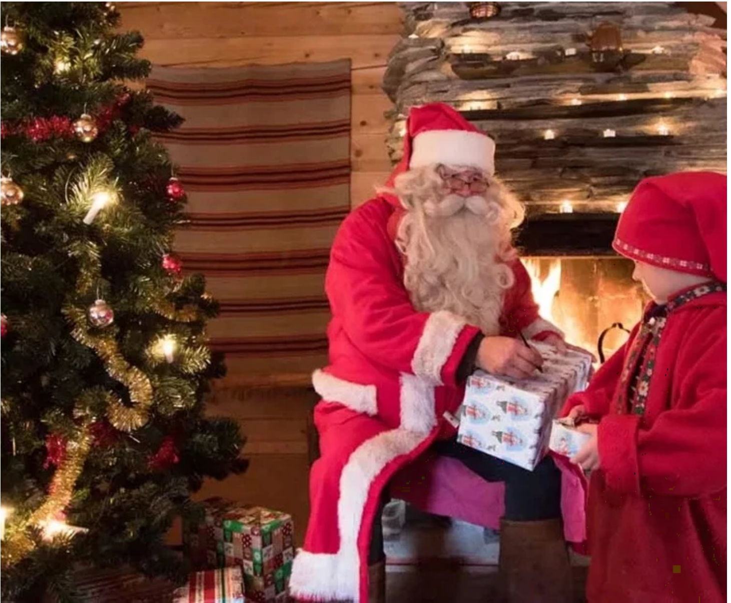
Cadeaux de Noël

Le chalet propose un hébergement au style communautaire, inspiré des refuges de montagne mais plus spacieux, favorisant le partage et la convivialité.