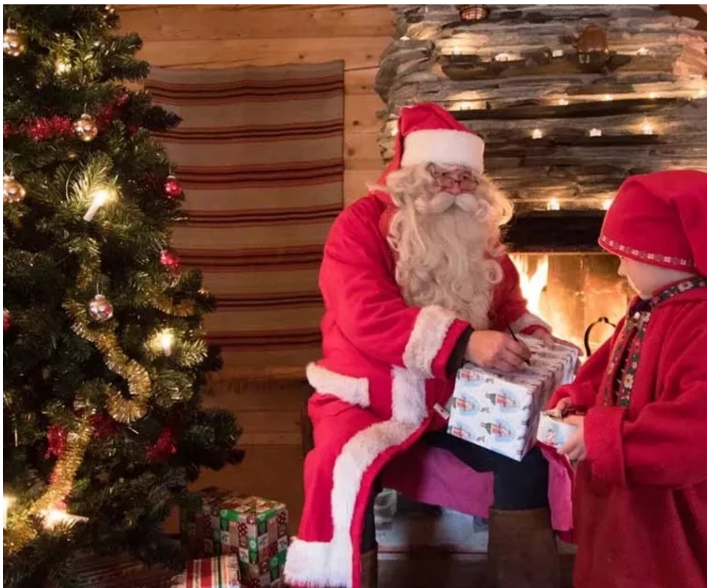
Cadeaux de Noël