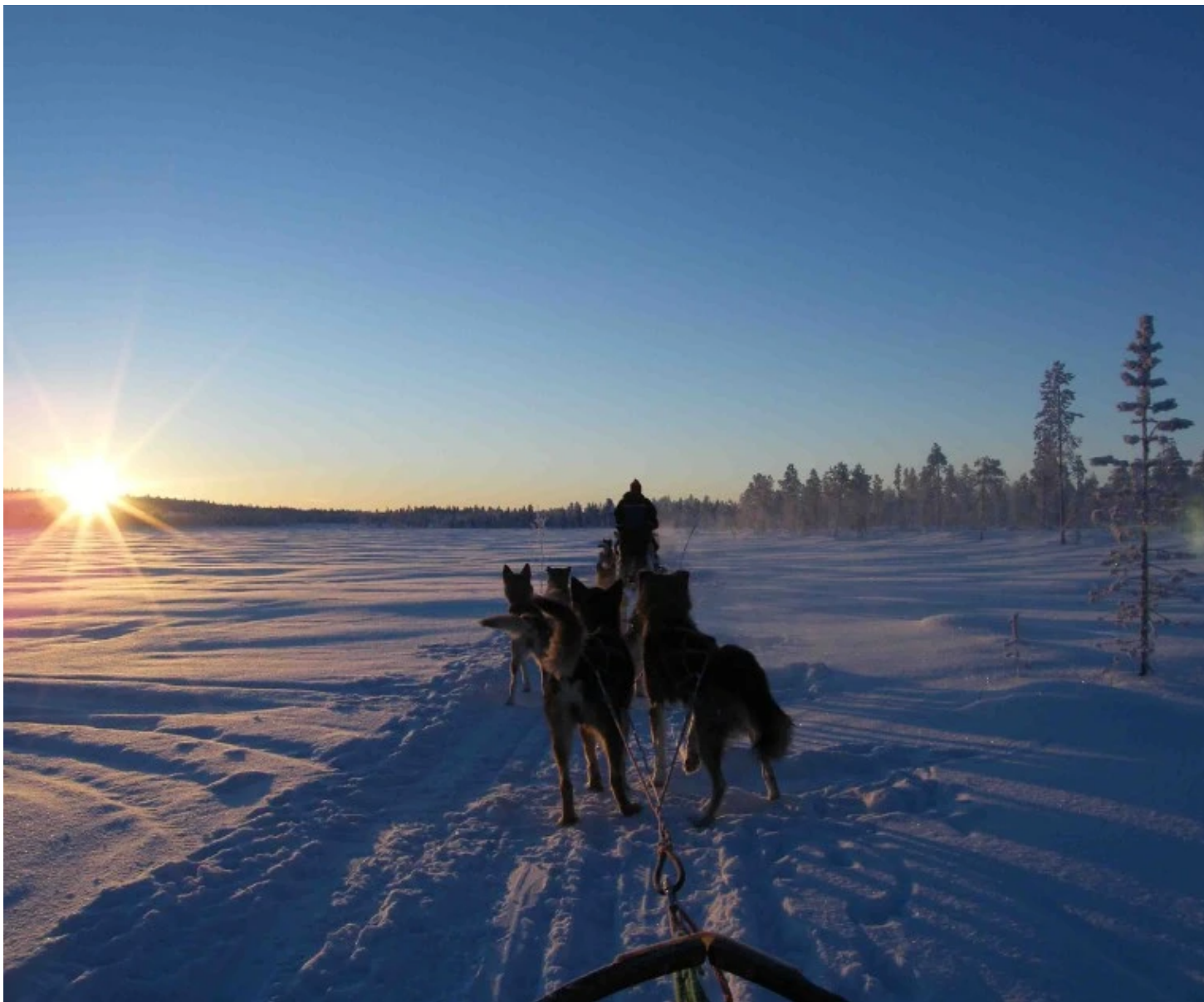
Traineaux de chiens