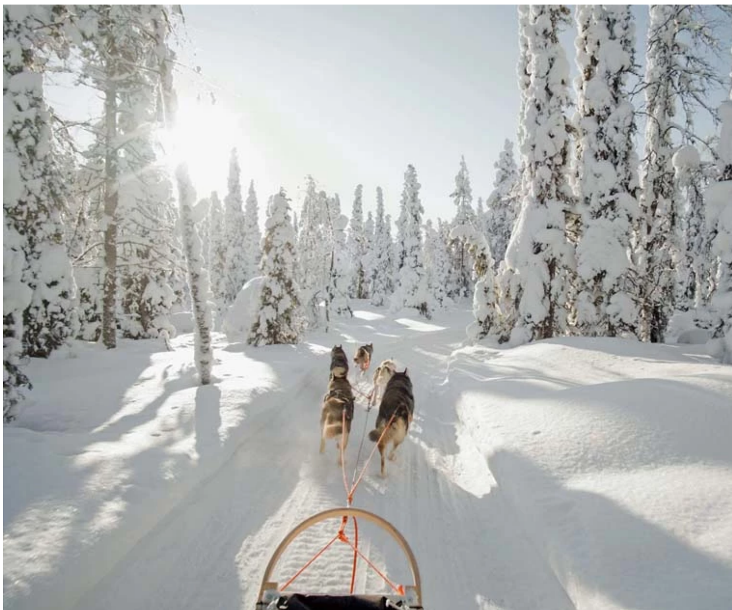
Traîneau de chiens