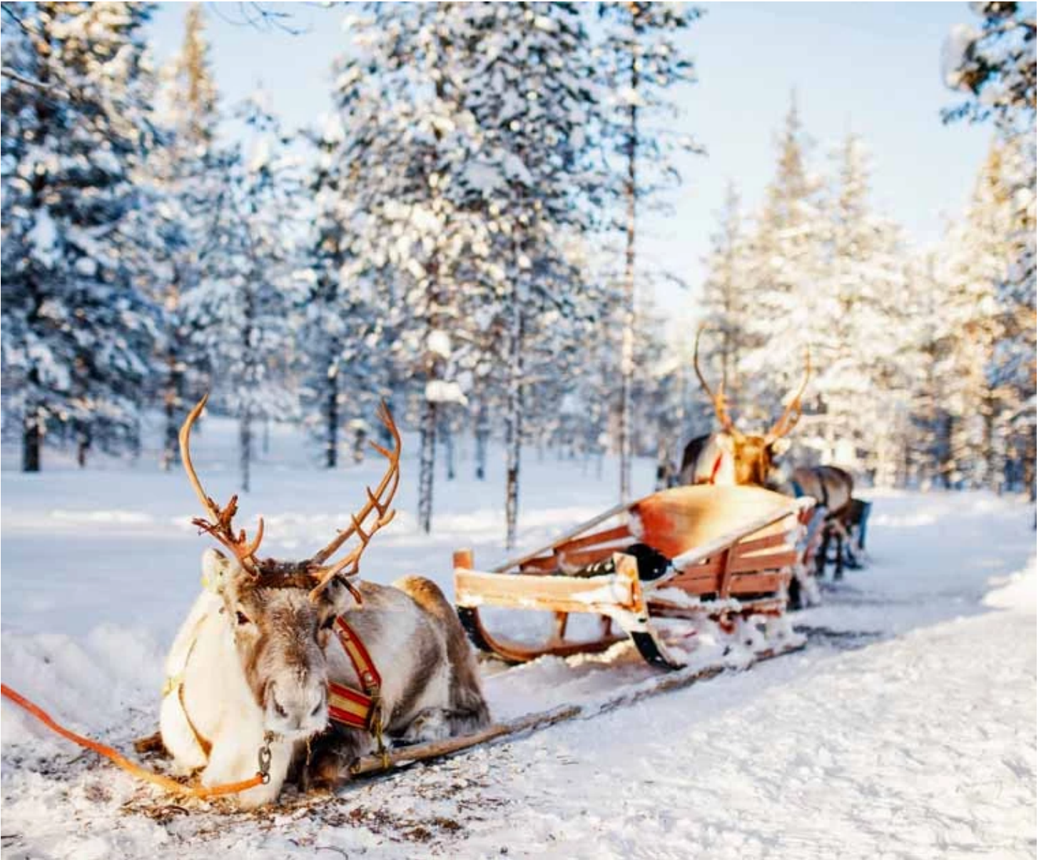
Traîneau de rennes