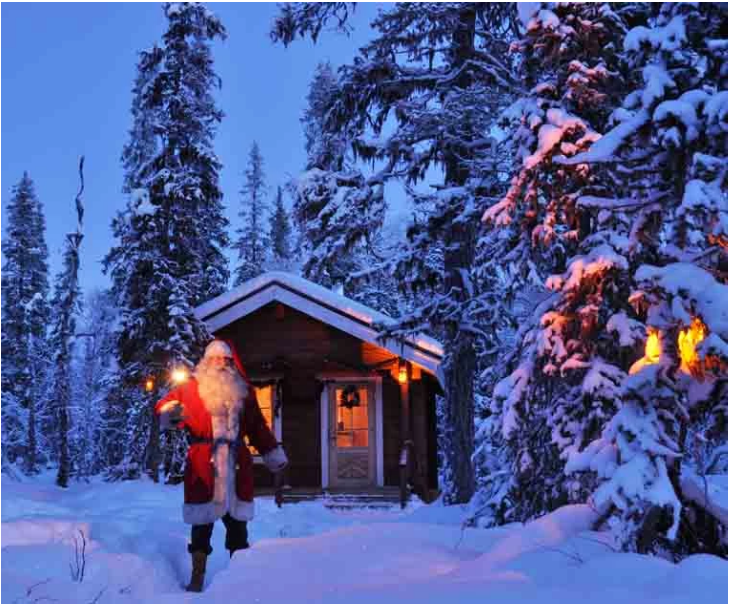
Maison du Père Noël

Et pour terminer cette journée remplie de magie, place à un dîner au coin du feu. Au bord du lac Jerisjärvi, dégustez un saumon cuit à la flamme, préparé selon les traditions laponnes, dans une ambiance chaleureuse et intime. Le crépitement du feu, l'odeur du poisson grillé et le cadre féerique vous garantissent une soirée inoubliable.