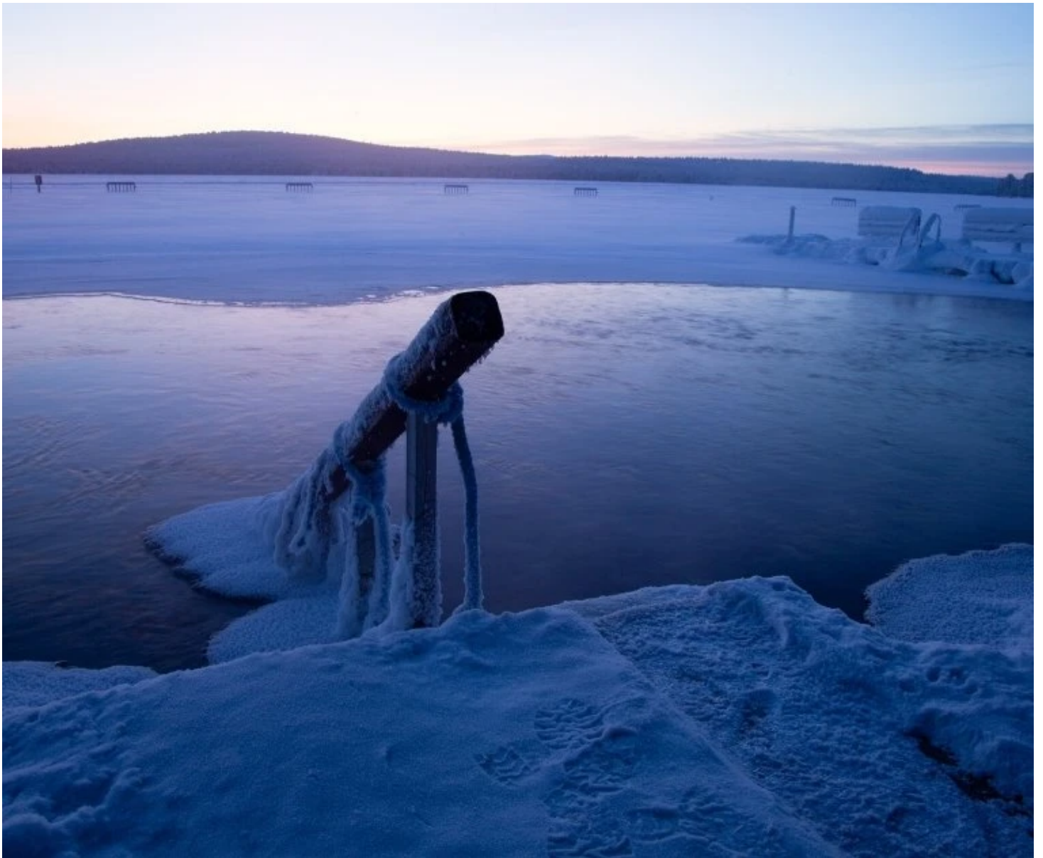
Avanto du Arctic Sauna World