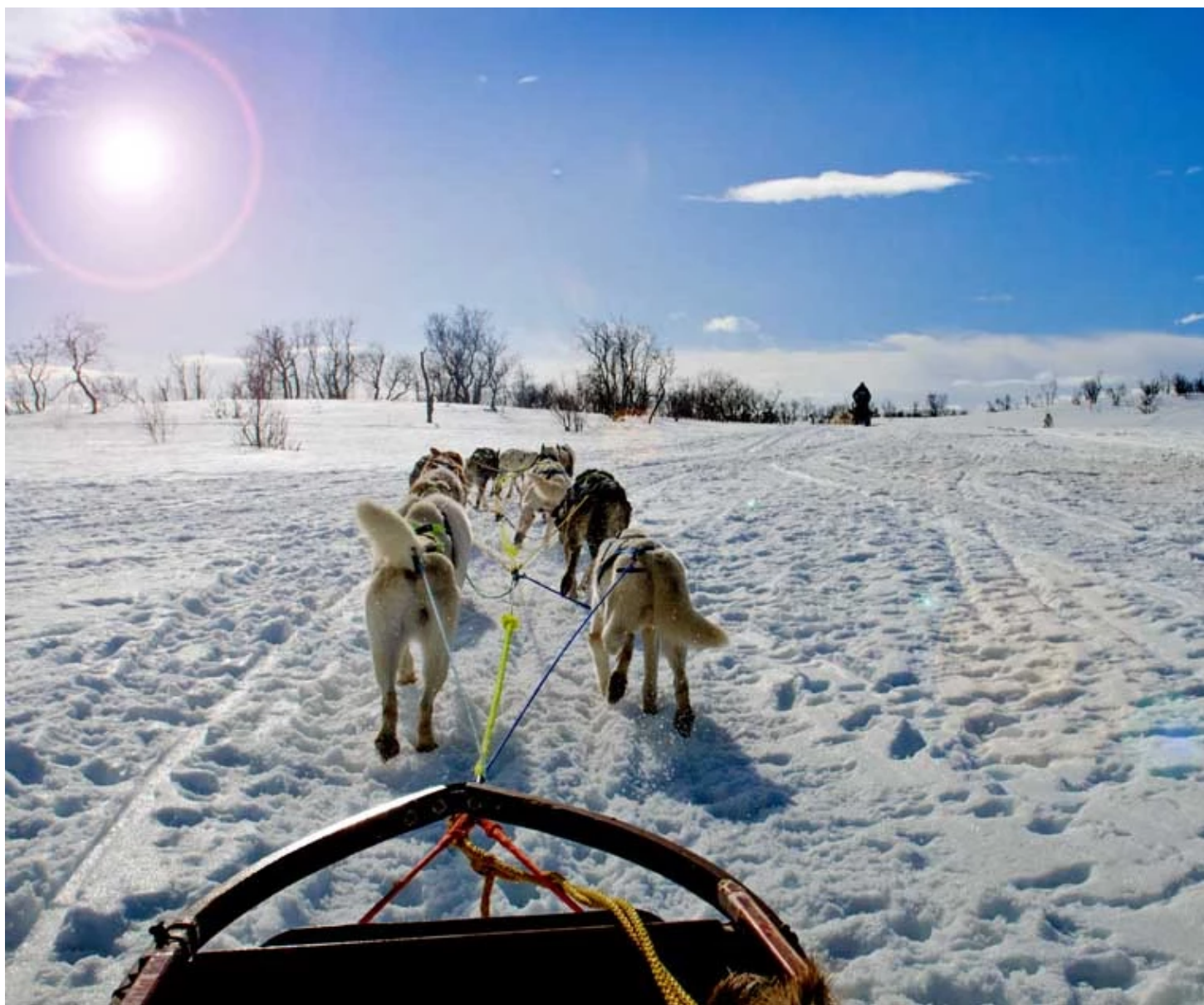
Traineau de chiens