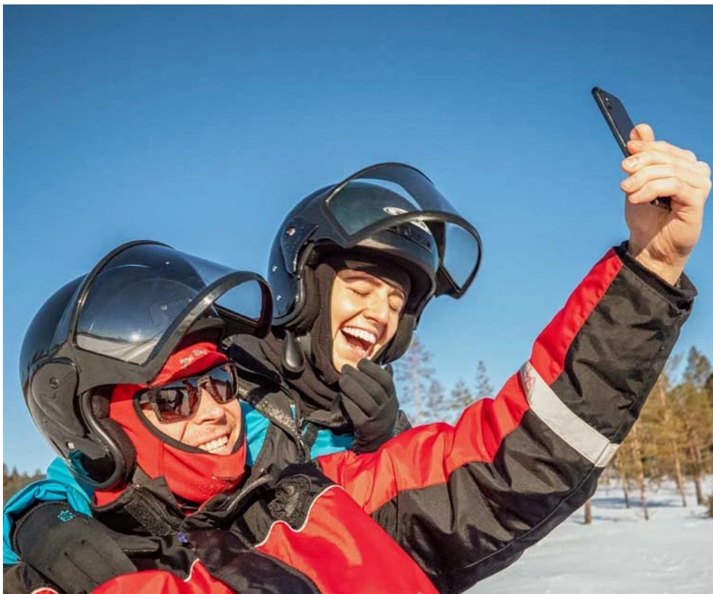
Pause selfie en motoneige