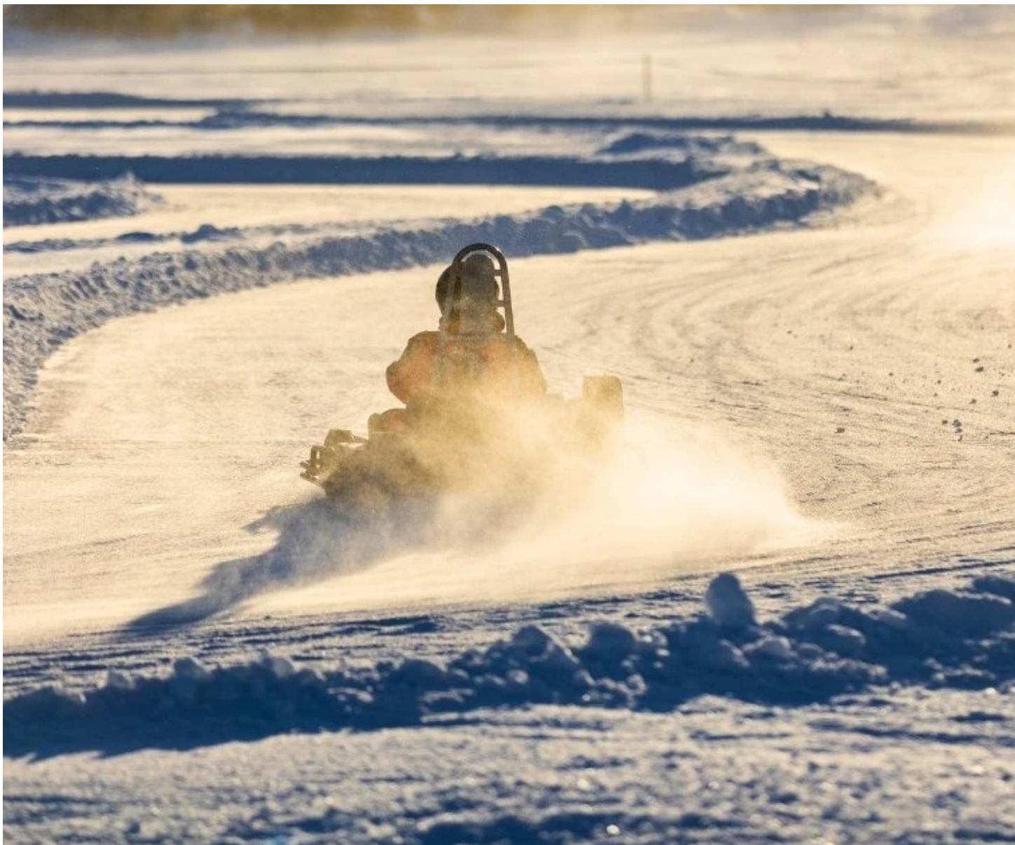
Kart sur glace