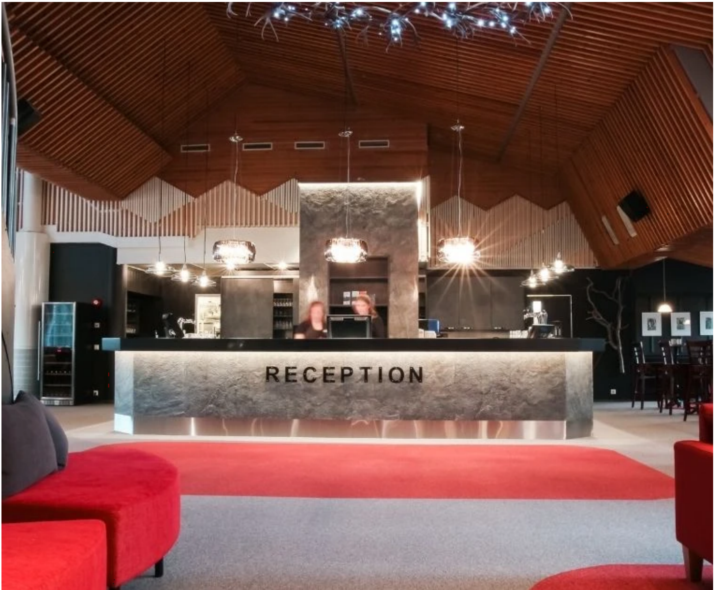
Réception de l'hôtel