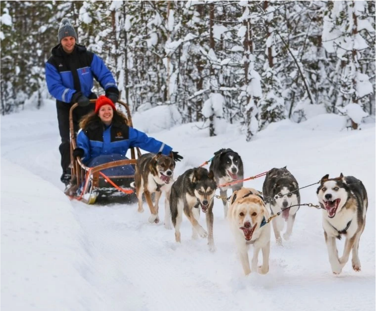
Traineau de chiens