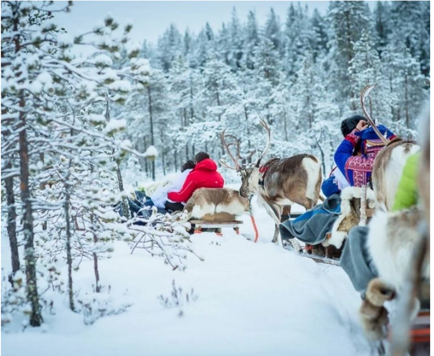
Traineaux de renne