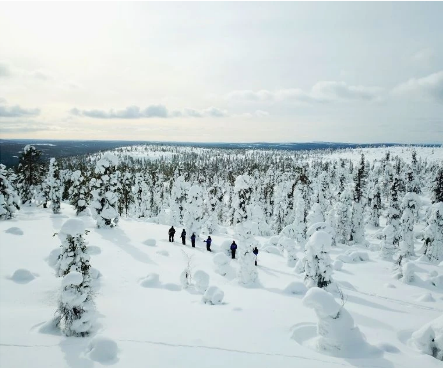
Ski de forêt