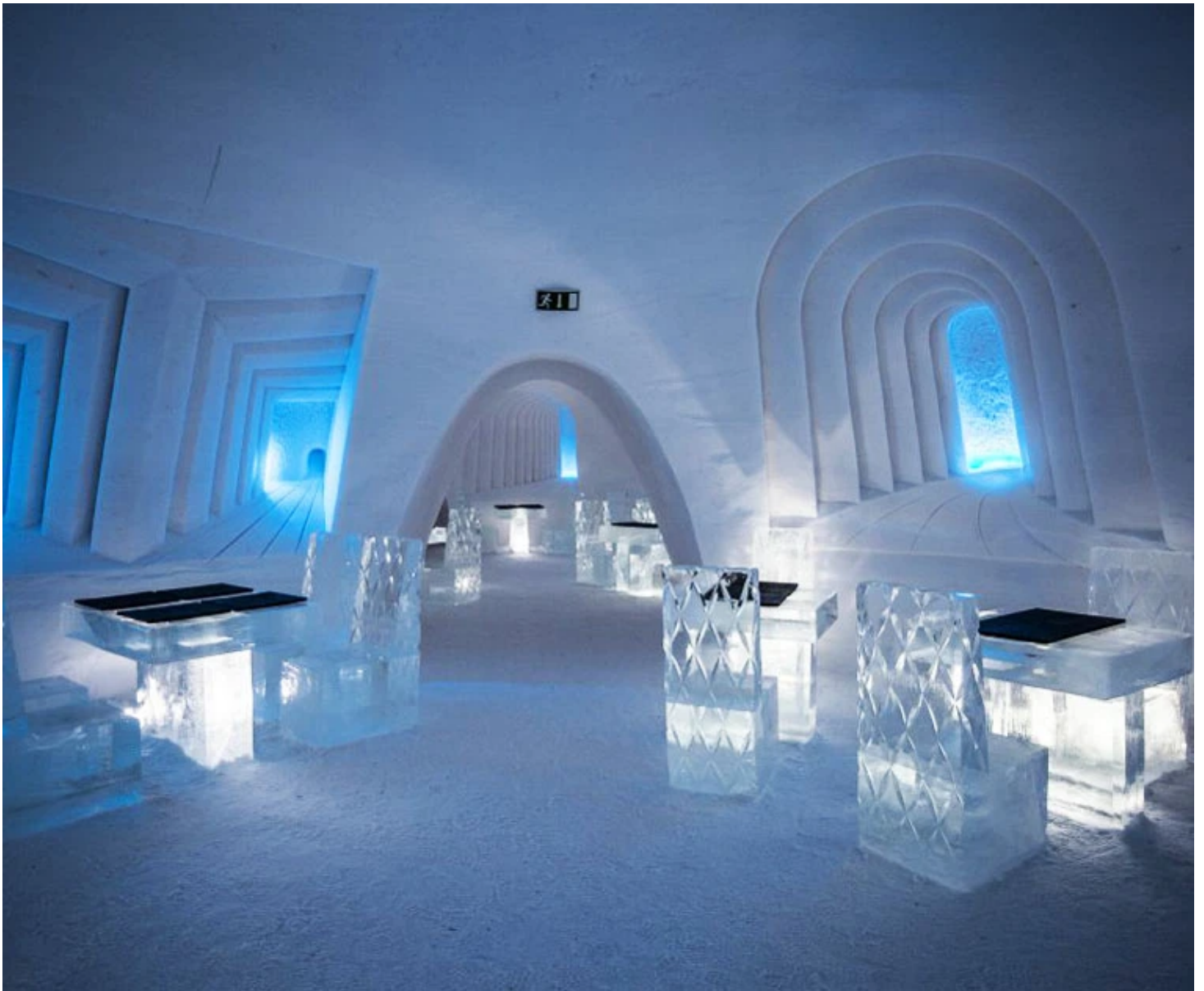
Restaurant de glace du SnowVillage