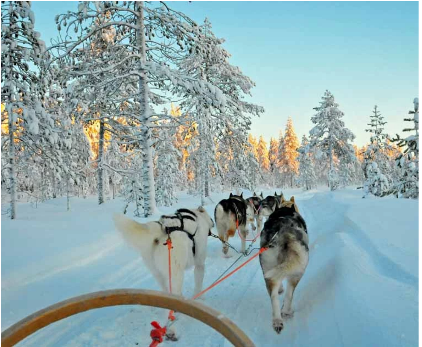
Traineau de chiens