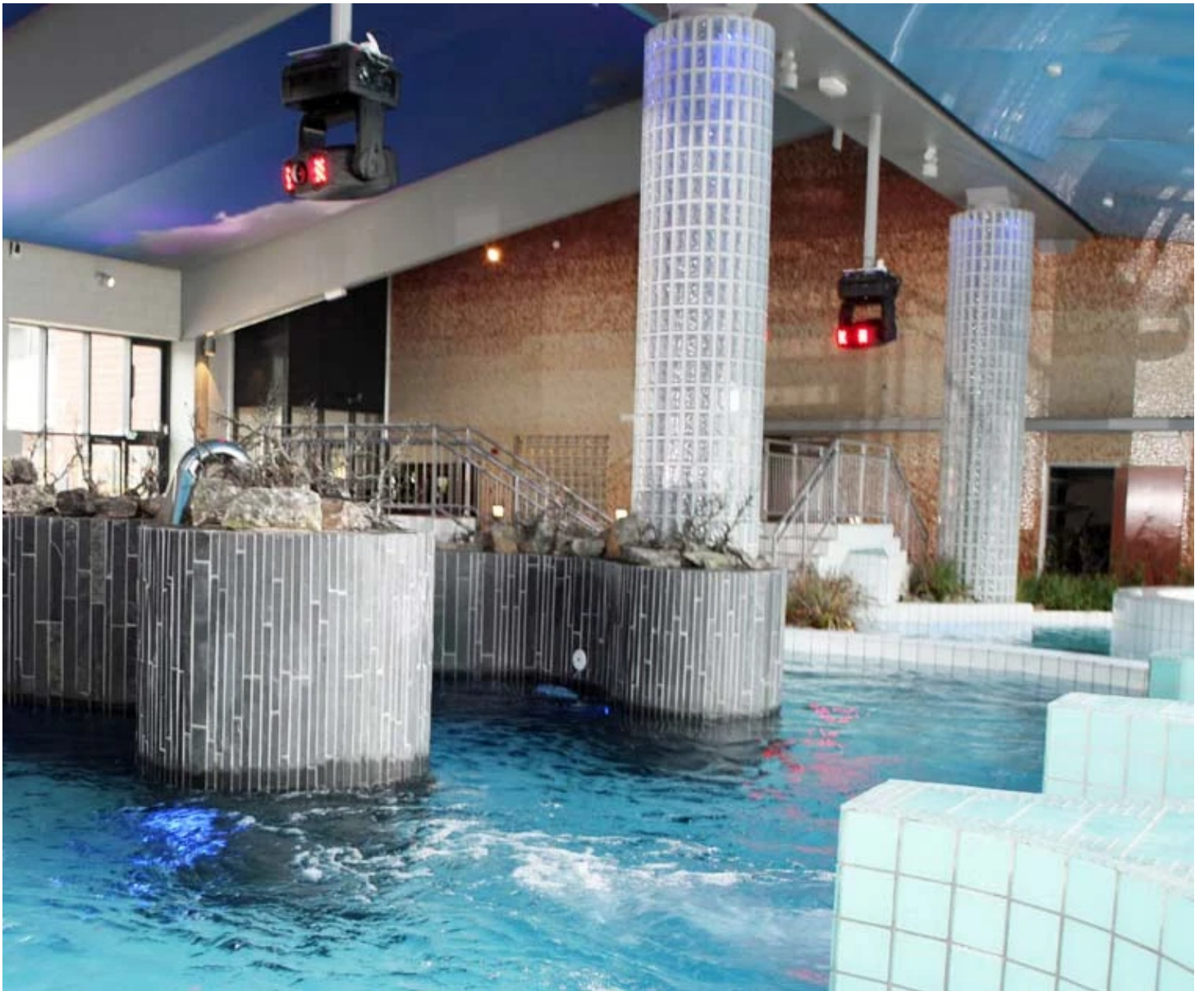
Piscine du Spa