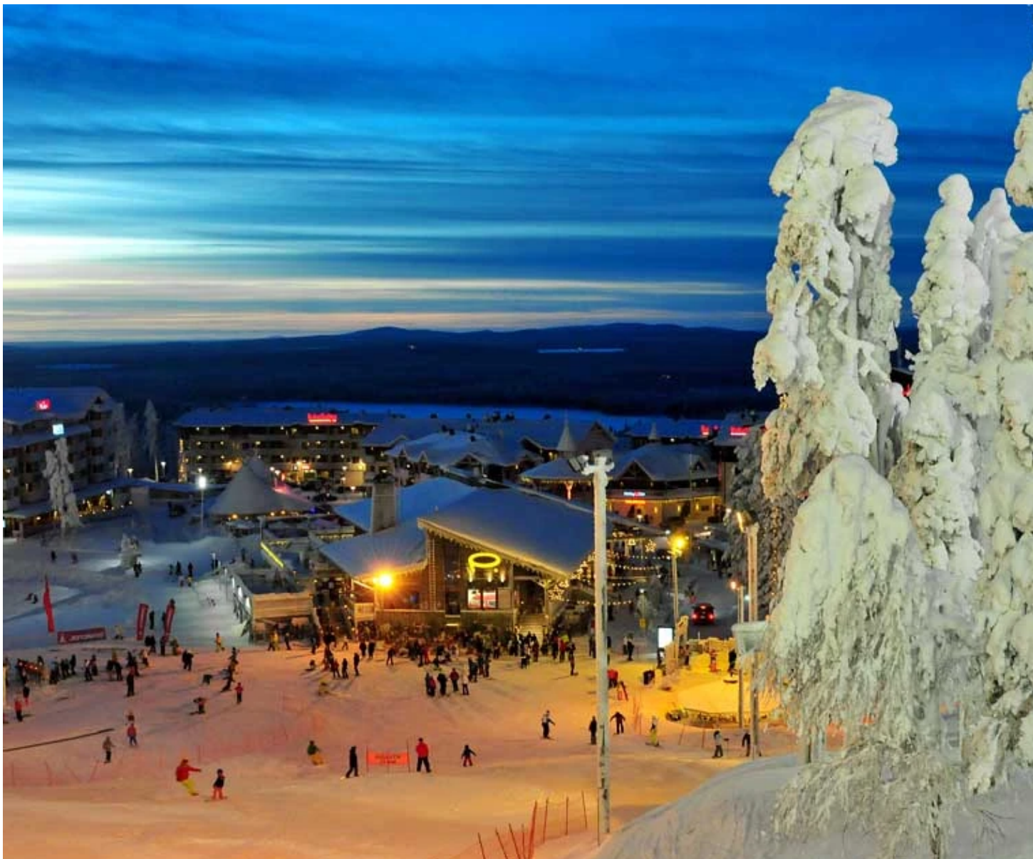
Station de Levi