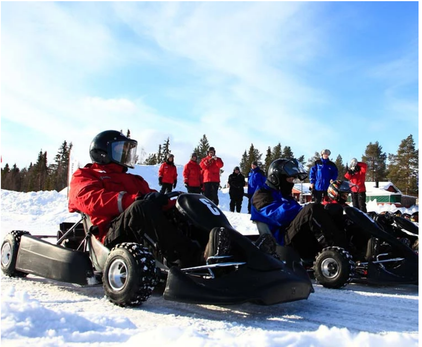
Karting sur glace