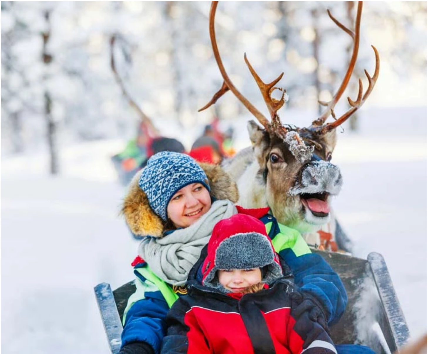
Traineau de renne