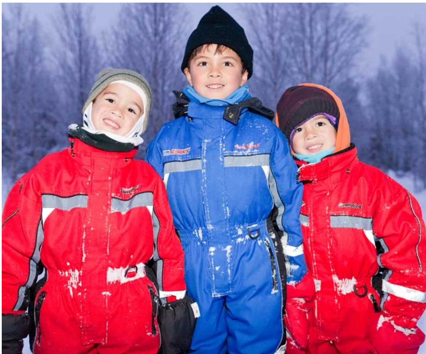
Équipement grand froid des enfants