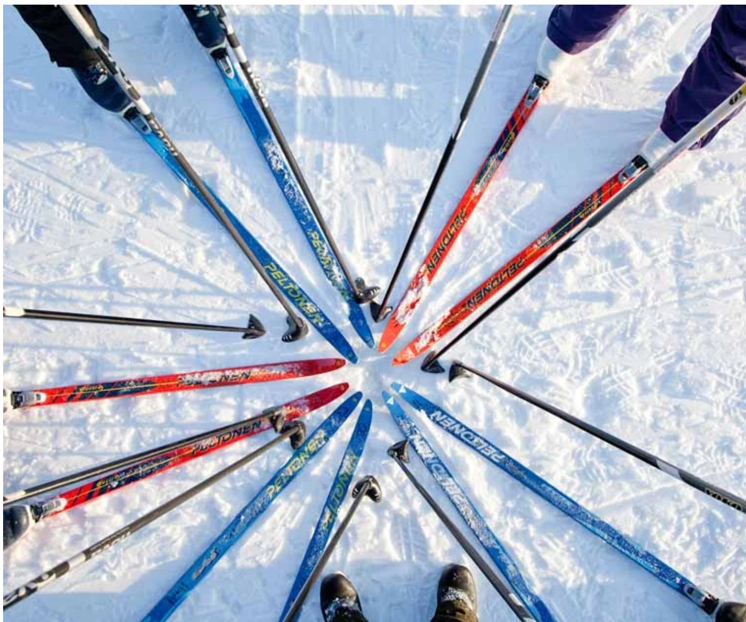
Skis de fond