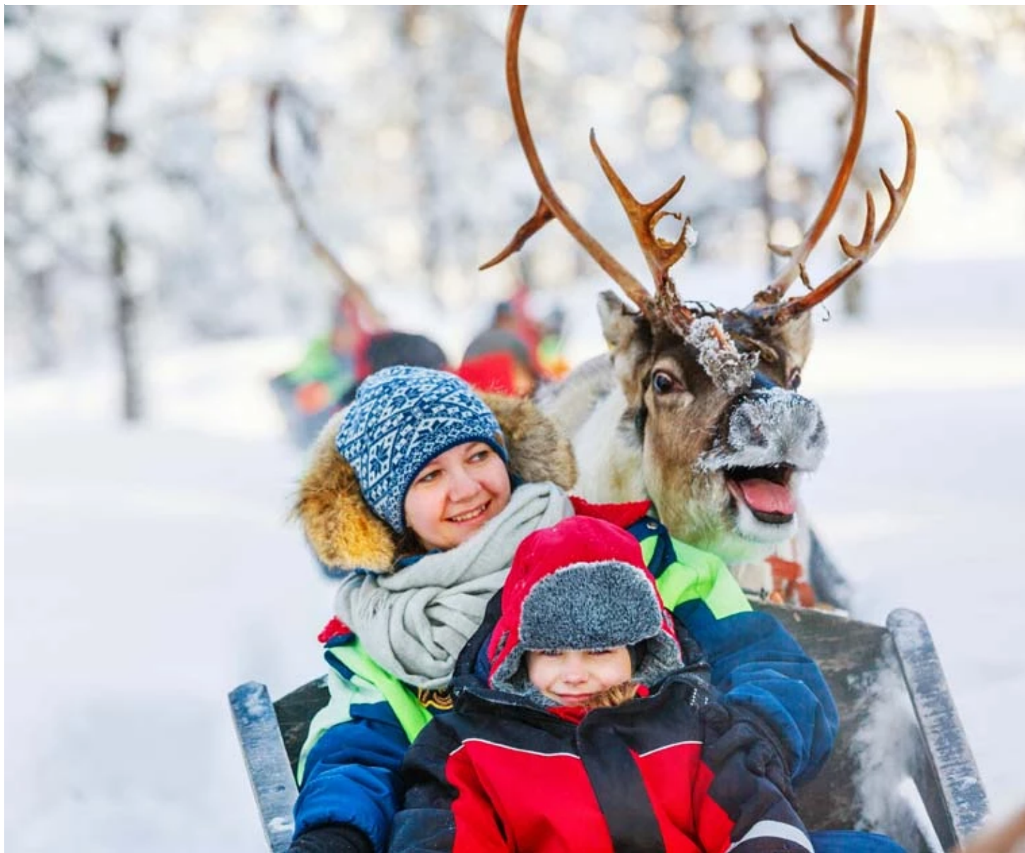
Traineau de renne

Promenade en motoneige dans les paysages arctiques