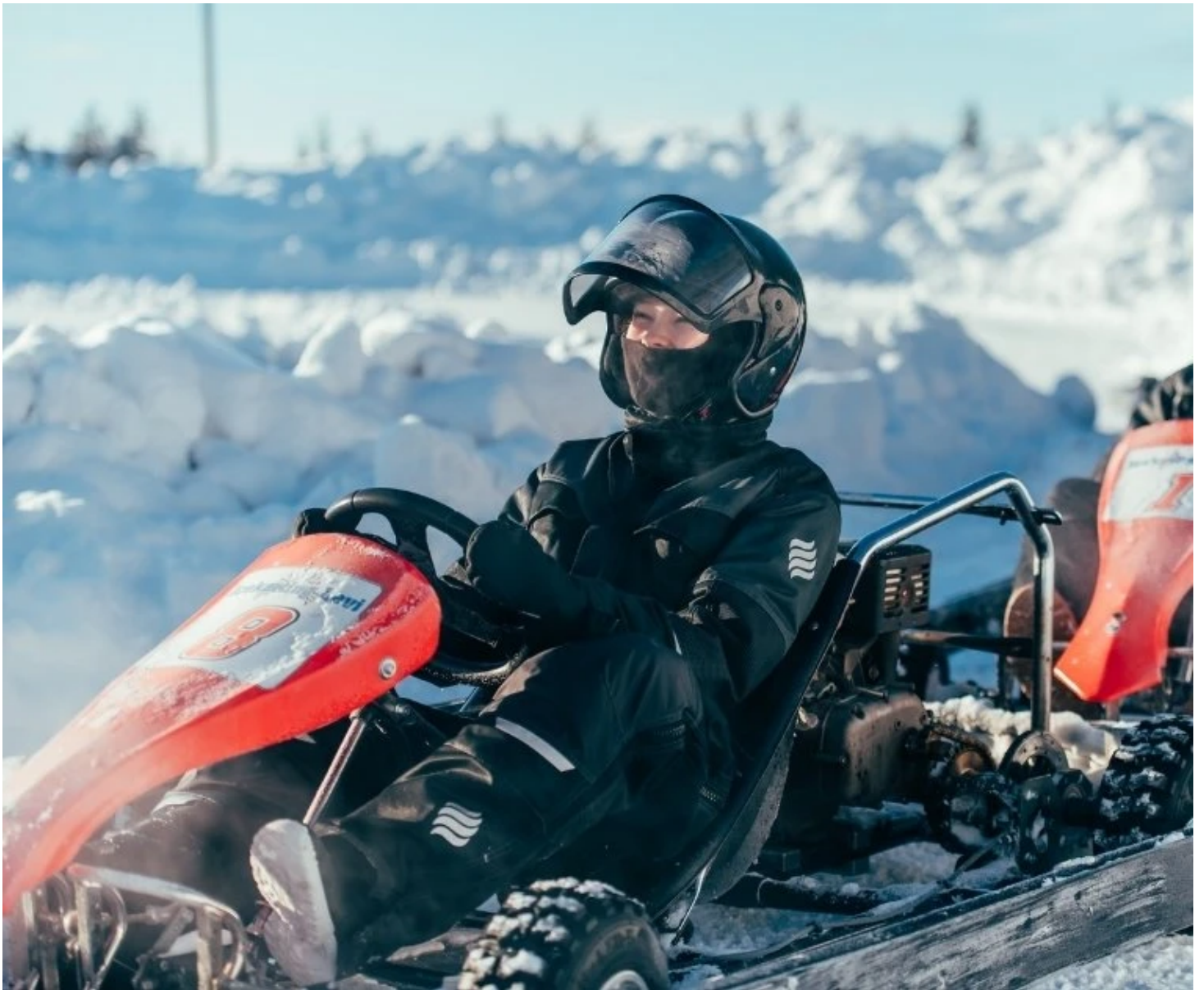
Kart sur glace