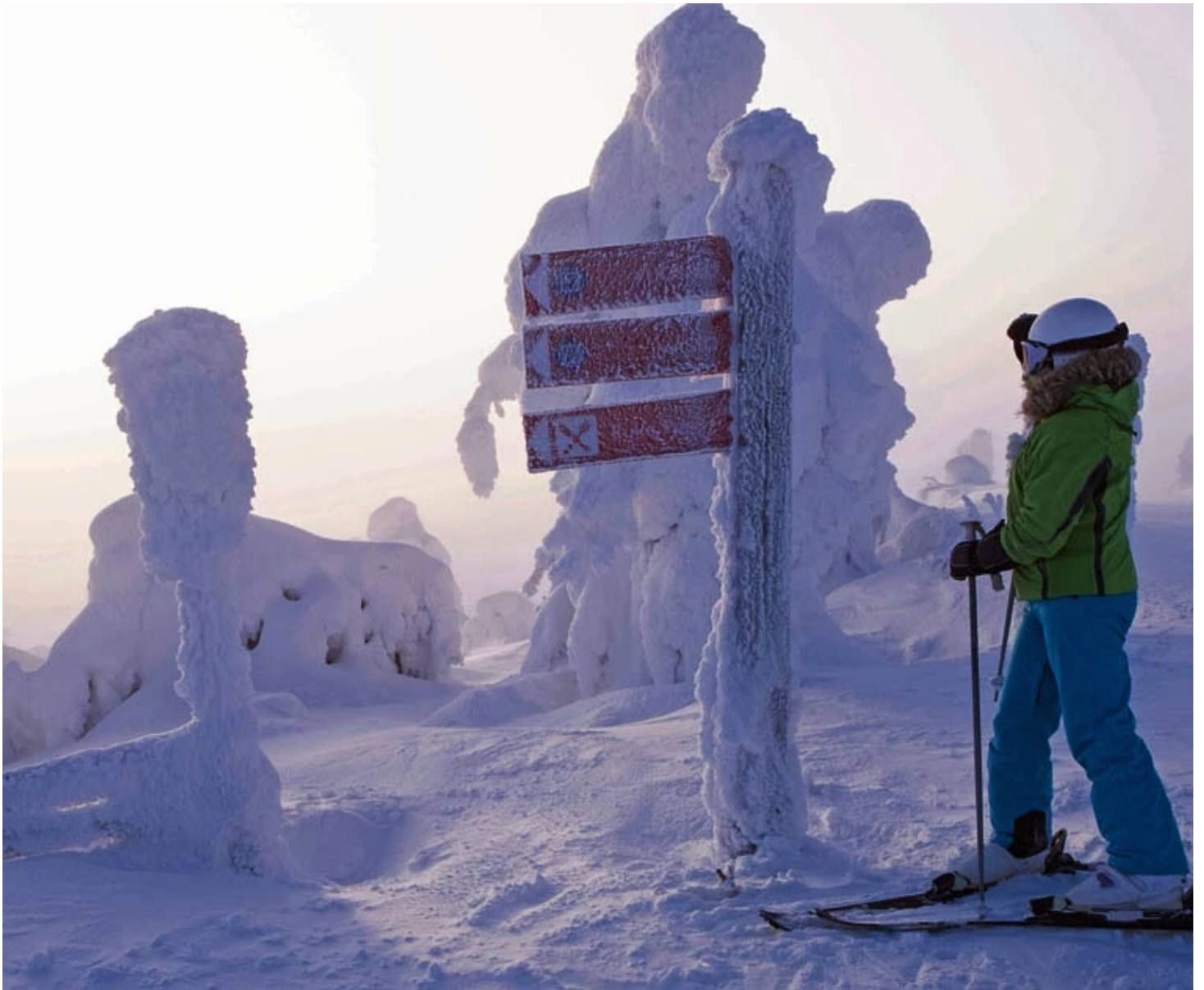
Skieuse devant les pancartes au sommet du mont Levi