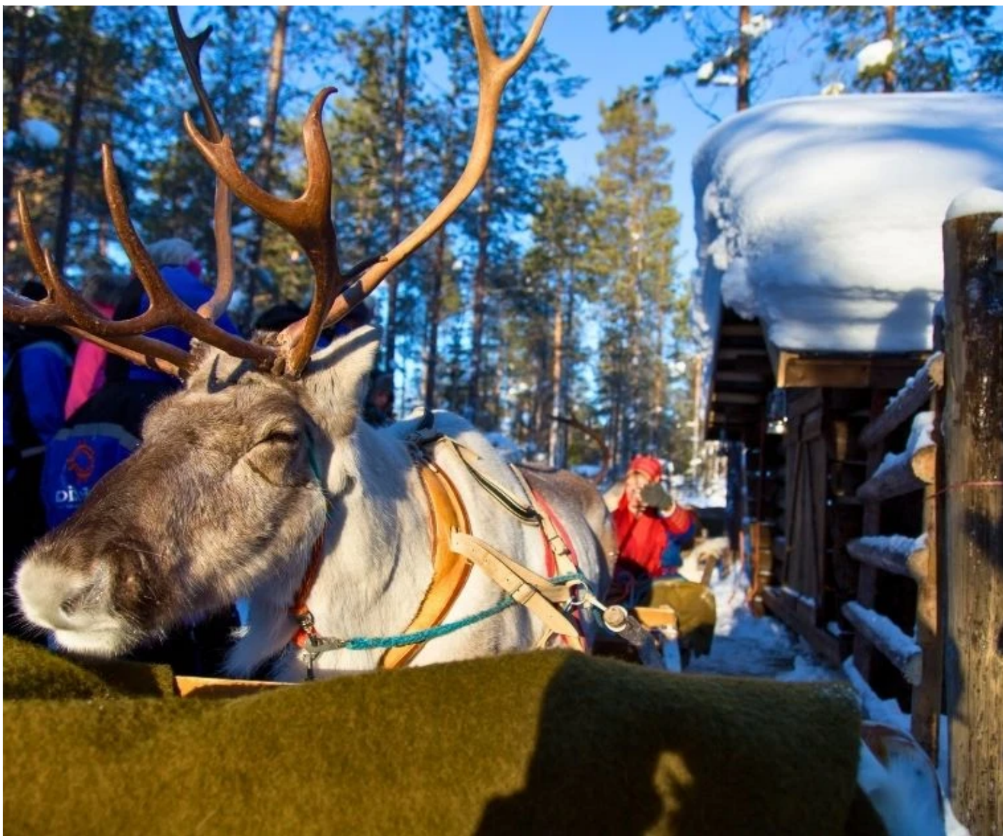
Traineau de renne