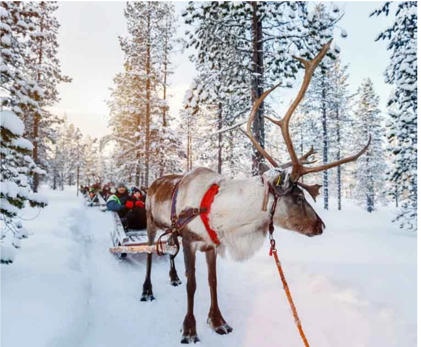
Traineau de renne