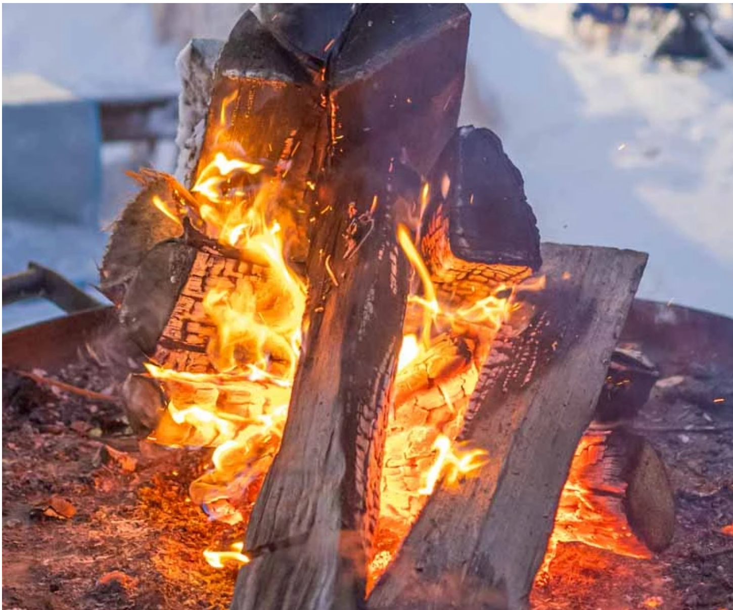
Feu de bois