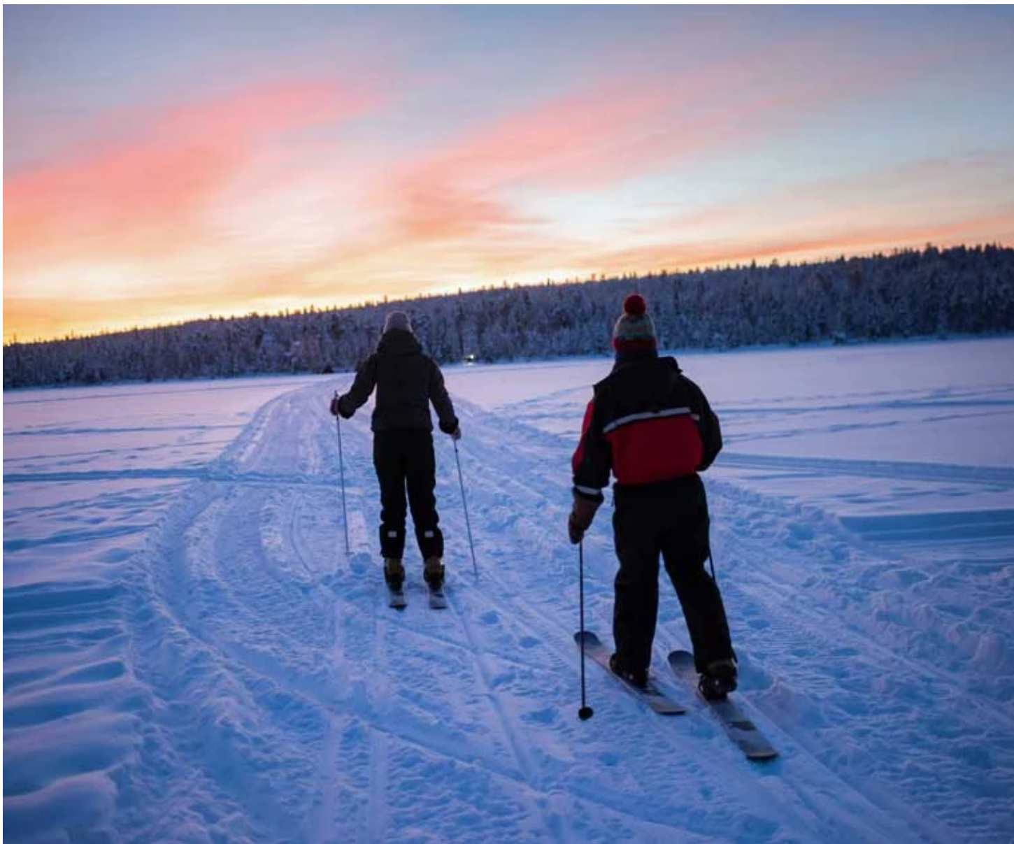
Ski de fond