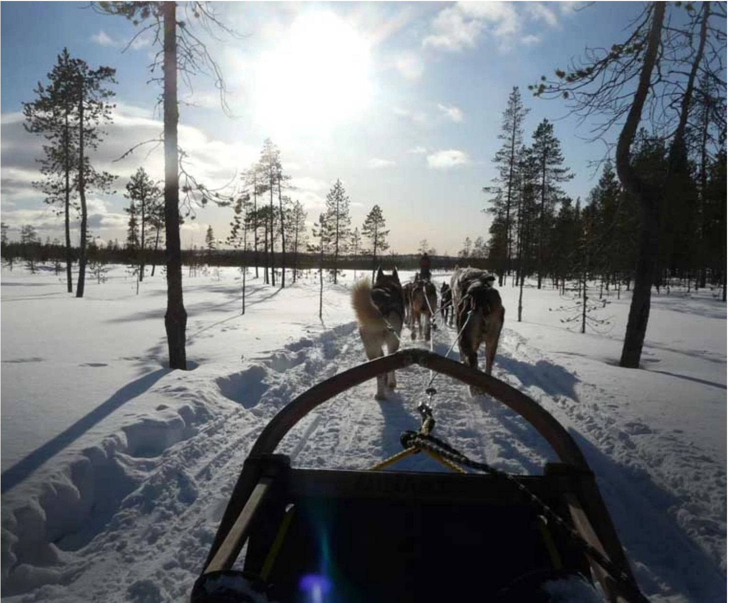
Traineau de chiens