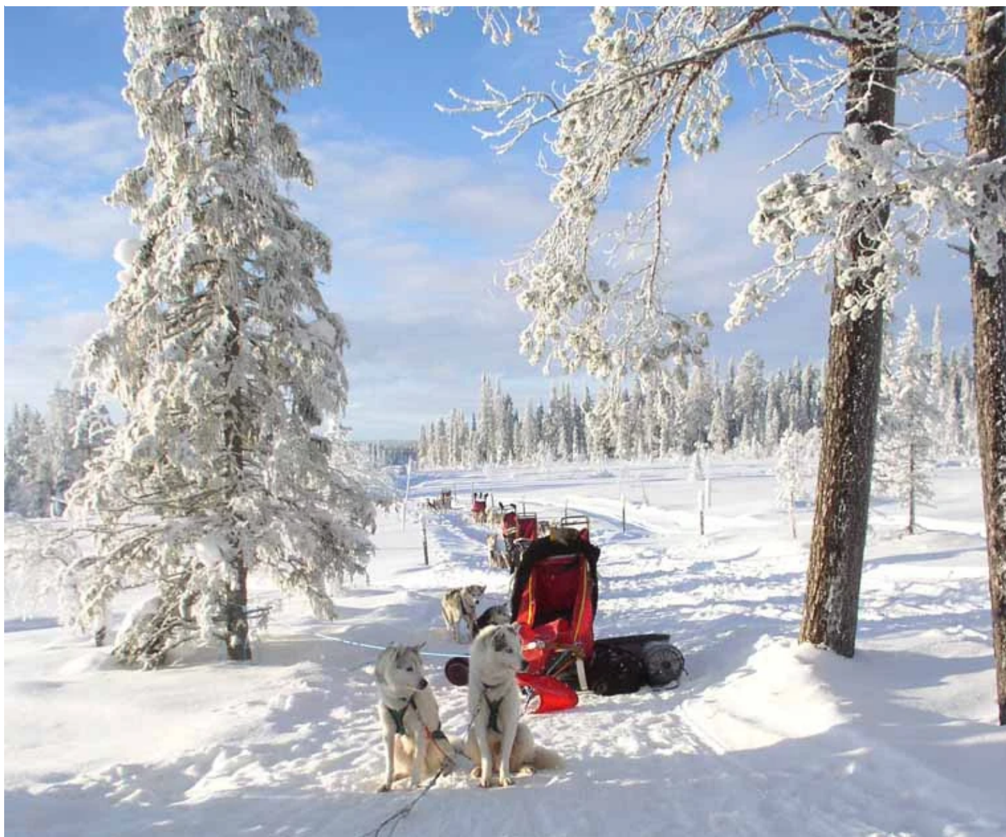
Traîneaux de chiens en pleine nature