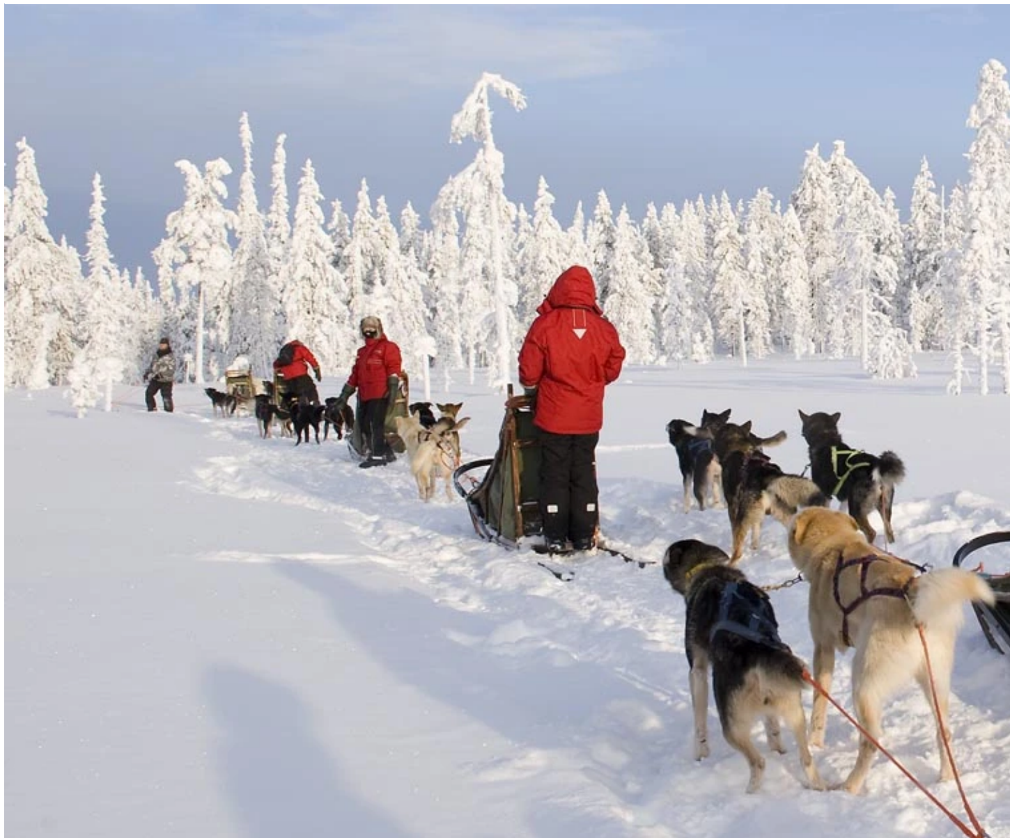
Traineaux de chiens aux abords de la forêt