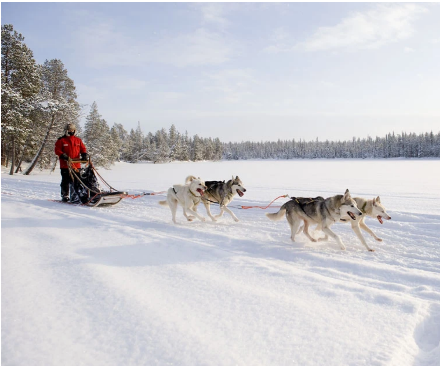
Attelage de chiens