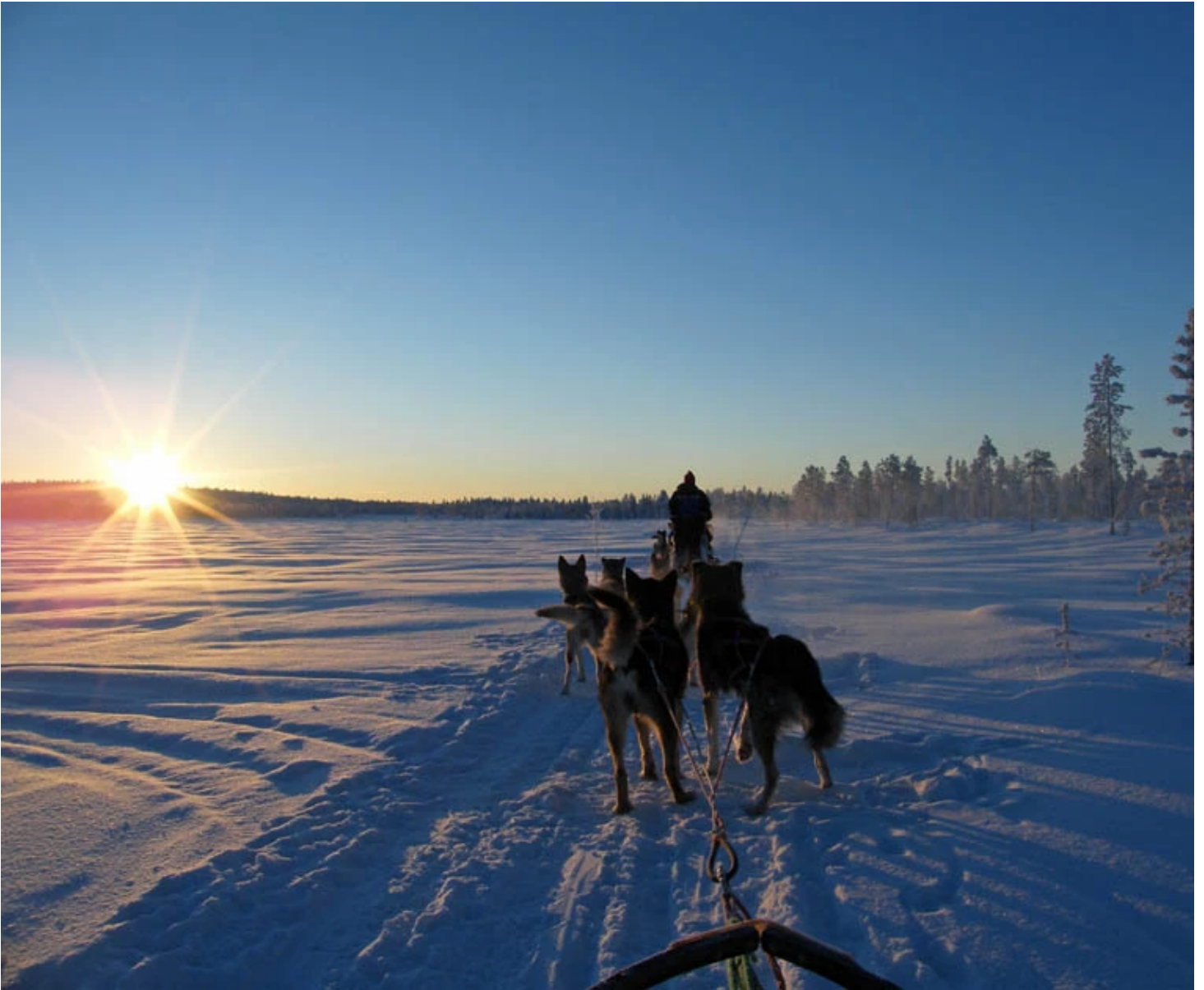
Traineau de chiens