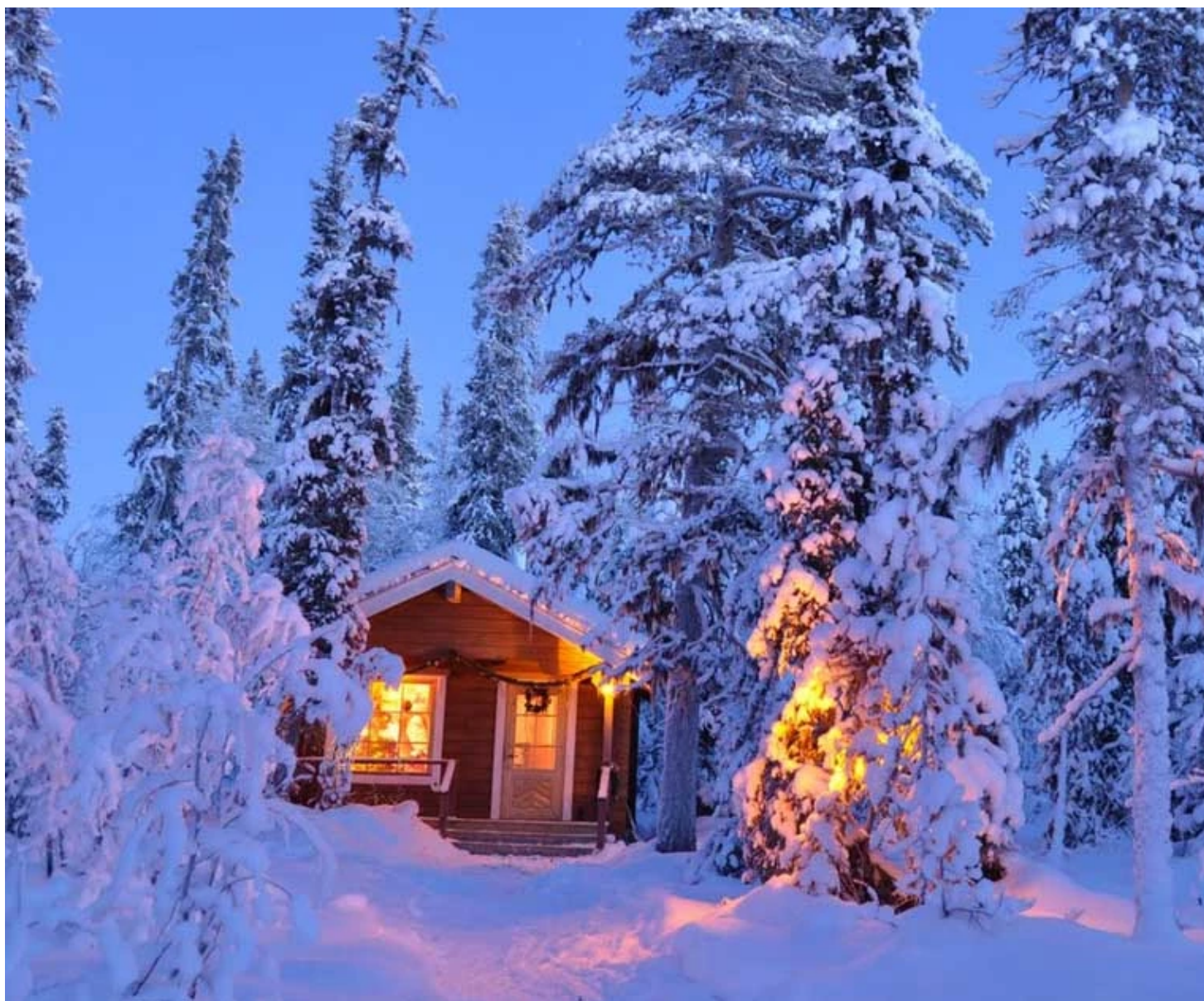
Maison du Père Noël