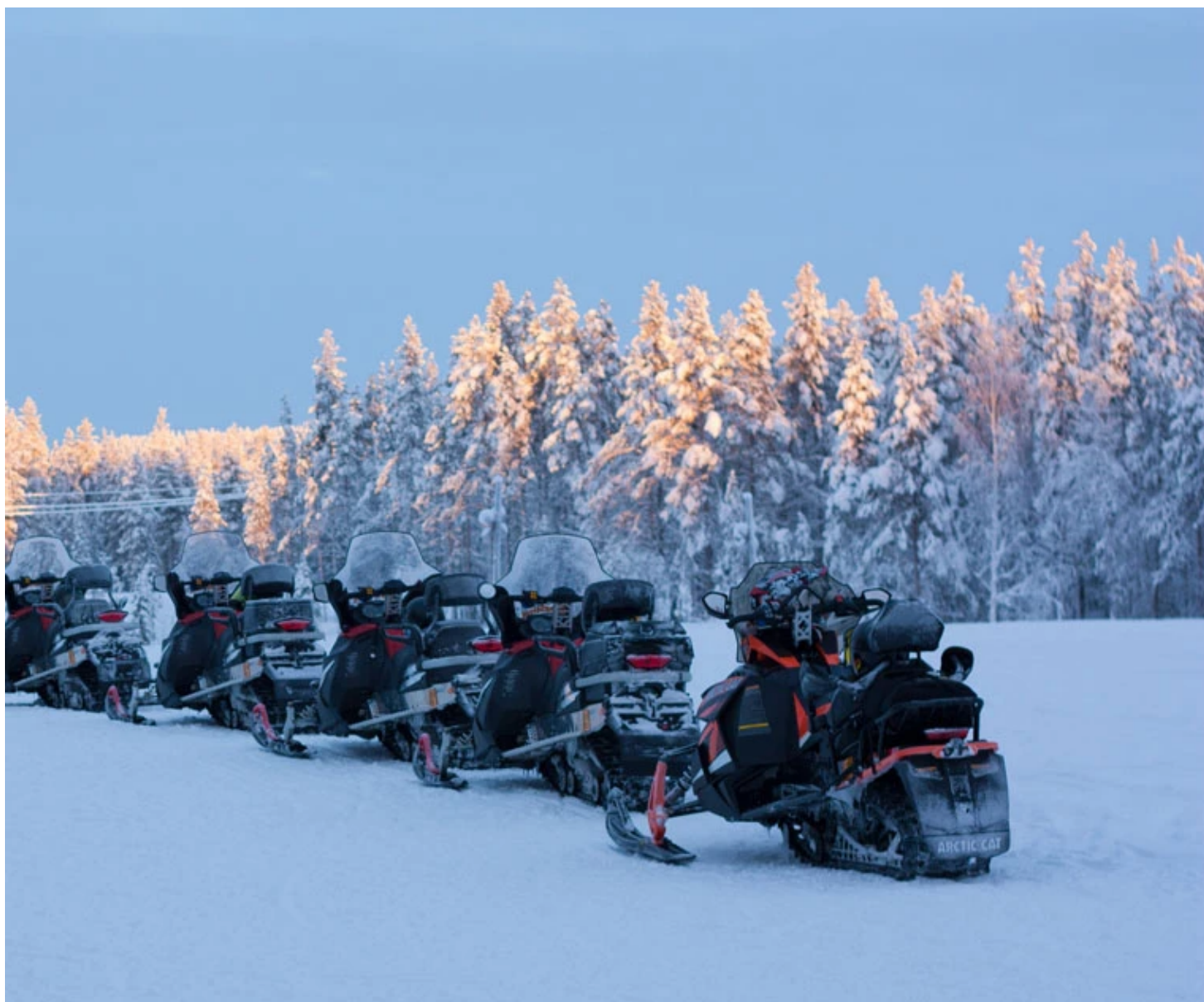
Initiation à la motoneige avant le verre de bienvenue